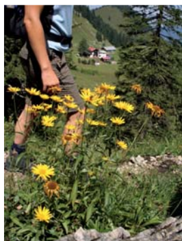
Wanderin mit Blick auf das Bodenschneidhaus

Der Abstieg erfolgt bis zu jener Stelle, an der der bezeichnete Waldsteig nach Neuhaus abzweigt, auf der Aufstiegsroute. Dann geht es jedoch auf dem Forstweg in nördliche Richtung stets geradeaus. Nach Querung der schönen Kraainsberger Alm führt der Weg durch das auch an heißen Tagen angenehm kühle Tufftal; das anfangs trockene Bachbett füllt sich rasch mit Wasser und ist bis zur Mündung in den Breitenbach unser steter Begleiter.